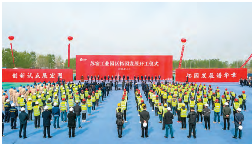
2020年4月14日,苏宿工业园区拓园发展开工仪式举行 (苏宿园区 供稿)

【《苏宿园区高质量发展总体方案》获批】 2020年12月20日,《苏宿园区高质量发展总体方案》在全省45个南北共建园区中首获江苏省委、省政府批复。江苏省委、省政府在批复中明确,支持苏宿园区率先开展省级南北共建园区高质量发展创新试点,要求苏宿园区在管理体制和运行机制上形