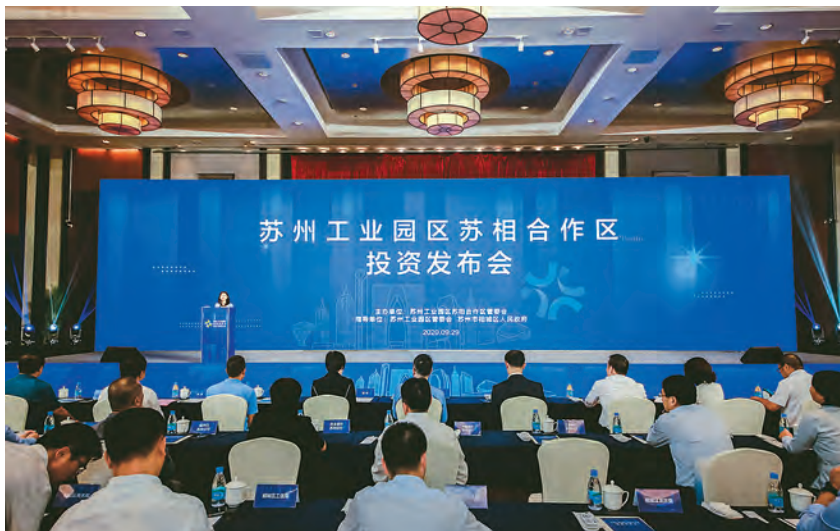
2020年9月29日,苏州工业园区苏相合作区投资发布会举办

项目建设。全年苏锡通园区实际利用外资及港澳台资1.7亿美元,增长25%;完成固定资产投资110亿元,增长5.5%,其中工业投资45亿元,服务业投资65亿元。资本招商格局加快形成,与清华紫荆、中金资本等知名机构合作成立多支产业基金,总盘50亿余元。招商引资方面,总投资50亿元的功率芯片、总投资1.45亿美元的欧亚马、总投资5亿元的康时光学膜等一批高质量内资项目落户苏锡通园区。招商载体形成规模,中新智能制造产业园、未来岛、环普现代产业园等一批在建都市工业综合体120万平方米,为“高精特新”项目落地创造有