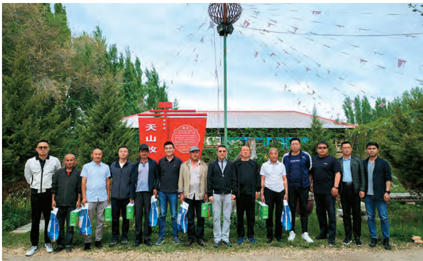
2020年5月2日,苏州援疆工作组走访慰问霍尔果斯结对亲戚

2020年9月24日,云痕大数据精准教学平台校园捐赠仪式在霍尔果斯市丝路小学举行。为使“教育信息化2.0”战略政策落地,促进边疆地区教学改革创新,苏州援疆工作组牵线,与上海数字化教育装备工程技术研究中心联手,捐赠一套云痕大数据精准教学平台的教学产品和扫描仪,供新疆霍尔果斯市丝路小学无偿使用。借助云痕大数据精准教学平台,丝路小学将利用云计算、人工智能等新一代信息技术,通过大数据采集和分析,提高教学决策的科学性,推动教学质量整体提升。