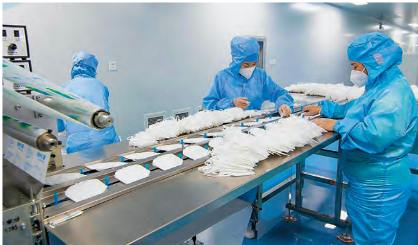
宁夏粤泰科技发展有限公司KN95口罩生产车间

小组,统筹动员企业、公安、物业等主体单位9个,做好苏银产业园新冠肺炎疫情防控工作、宣传指导和舆论监测工作。采购并发放防疫物资,保障园区各企、事业单位新冠肺炎疫情防控工作需求。坚持新冠肺炎疫情防控和经济社会发展“双线作战”,支持企业转型生产。截至年底,苏银产业园有口罩生产线46条,其中KN95生产线28条,杯型口罩全自动生产线5条,普通医用防护口罩生产线13条,口罩日产能352万只。宁夏粤泰科技有限公司生产的400万只KN95口罩,由苏银产业园运往天津港再由海运发往泰国,开启海外市场销售模式,为世界新冠肺炎疫情防控工作做出贡献。